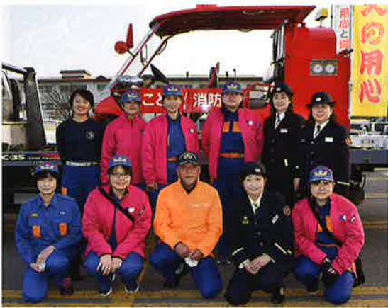
☆総合3位入賞の弘前市消防団女性分団の皆さん おめでとうございます！

大会を実際に見学して、「知識」「瞬間の判断」「経験」の3つが要だと思いました。 トリアージでの20秒以内での判断、限られた資材での多人数の救急処置、避難所運営では早い時間の流れで熟慮する時間を与えず次々とくる問題を解決していく、瓦礫の下になった傷病者をどう助けるのか；等、私実践するのならば時間があまりにも足りないだろうと感じました。しかし、目の前の選手たちは、少ない時間の中真剣な眼差しで不安な傷病者に声をかけをし、安心させる確な処置をしていきます。 他にも、救急処置や瓦礫からの救助など、消防団員としてとても興味深かったです。 先上げた3つの要をすべて習得し、実践しているのがここにいる参加選手たちなのだと感じました。初めはできないかもしれないが、経験を積み、一人では不可能なことをチームで分担することでクリアできるようになっていく、自分もぜひその経験を積んでみたいと心に強く思いました。